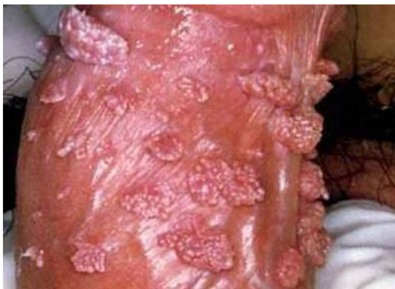
-Những nốt sùi mào gà tại thân dương vật