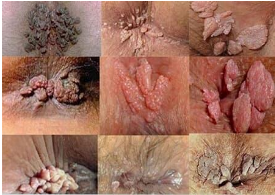
-Triệu chứng sùi mào gà ở vùng hậu môn