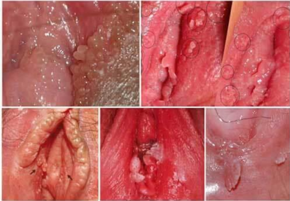
- Hình ảnh sùi mào gà tại nữ