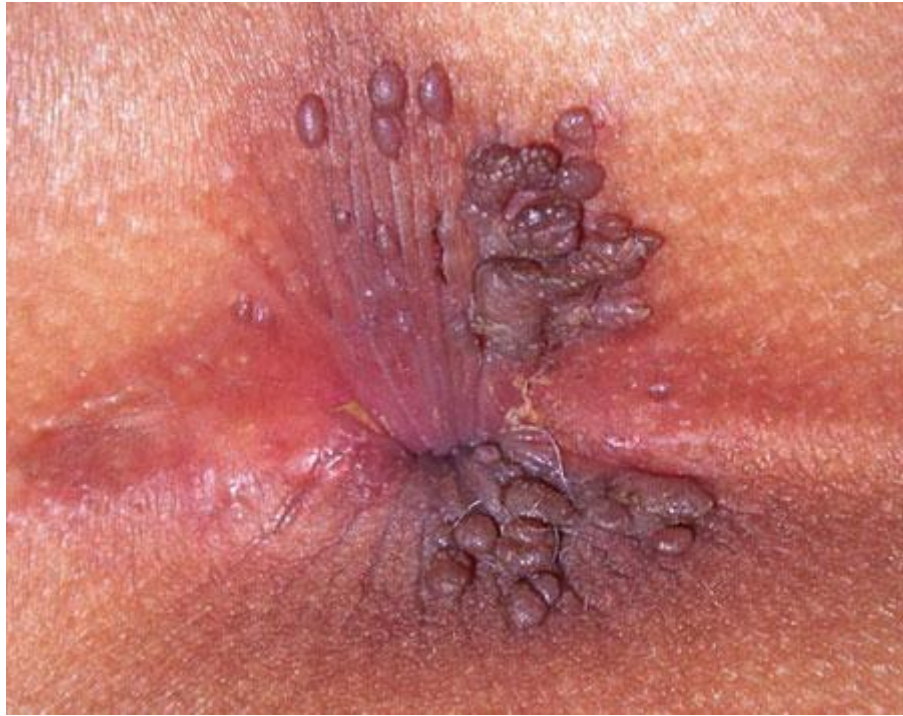
-Hình ảnh sùi mào gà ở vùng hậu môn