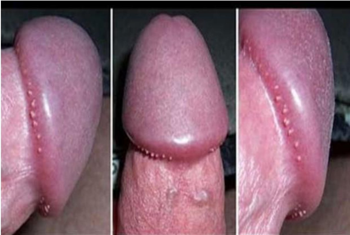
-Hình ảnh sùi mào gà tại rãnh lớp da bọc dương vật