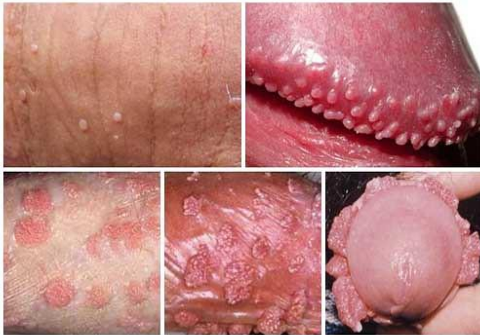
- Hình ảnh sùi mào gà tại phái mạnh