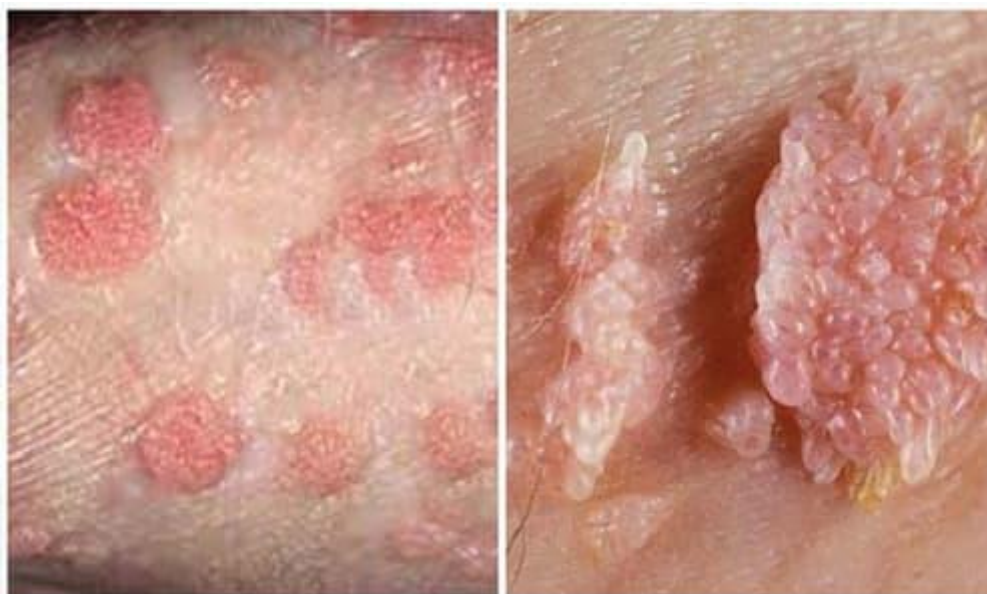
- Hình ảnh sùi mào gà ở nam và nữ

Lúc sùi mào gà phát bệnh, bạn có khả năng nhanh chóng phát hiện sùi mào gà ở bao quy đầu, môi bé, âm đạo, cổ tử cung, miệng, vòm họng, chân tay hoặc ở vùng hậu môn qua những hình ảnh cận cảnh như sau: